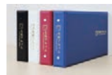
ミニ色紙アルバム