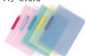
スライドクリップファイルはさんど〜