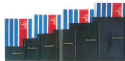
1961年日本初の透明ポケット式ファイル「ニューホルダー」発売 (当時)