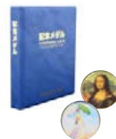
記念メダルシリーズ