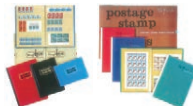
種類豊富な切手アルバム (当時)