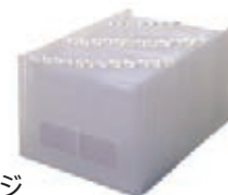
ドキュメントファイル