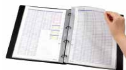
File it シリーズ