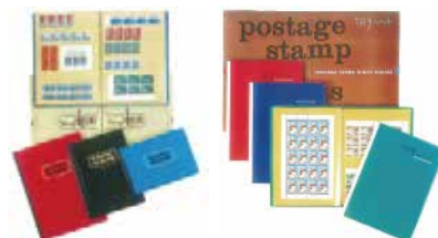
種類豊富な切手アルバム（当時）