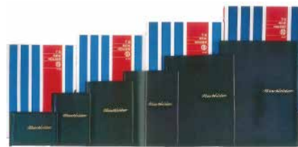
1961年日本初の透明ポケット式ファイル「ニューホルダー」発売（当時）