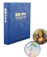
記念メダルシリーズ