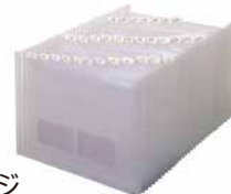
ドキュメントファイル