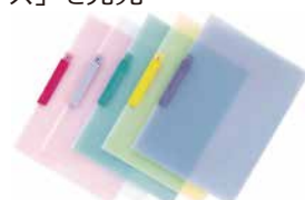
スライドクリップファイルはさんど〜