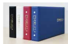
ミニ色紙アルバム